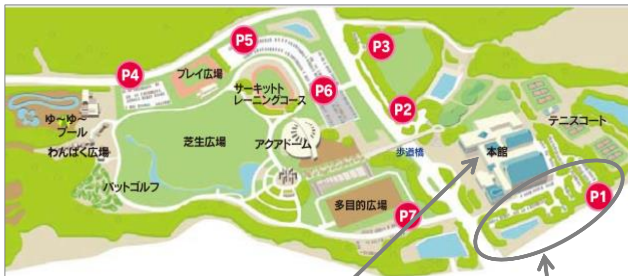
実技試験会場 (本館イベントホール)